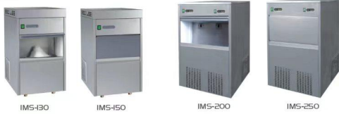
天驰系列全自动雪花制冰机技术参数